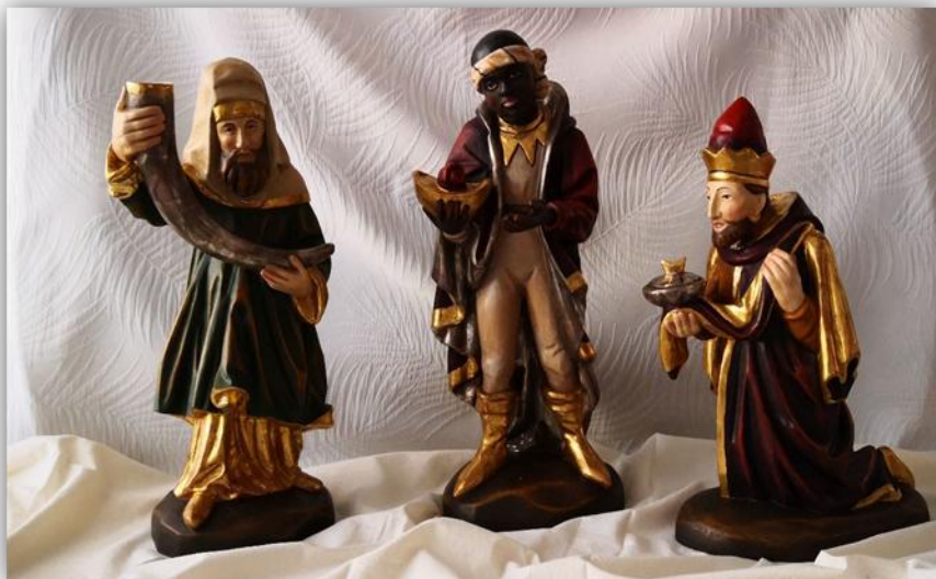
Drei Könige auf dem Weg zur Krippe in der Liebfrauenkirche